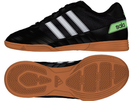
中用フットサルシューズ

※シューズの裏面は写真のような飴色ものが オススメです。 他の色の場合、公式戦で使用許可が出ない こともありますので、ご注意ください！