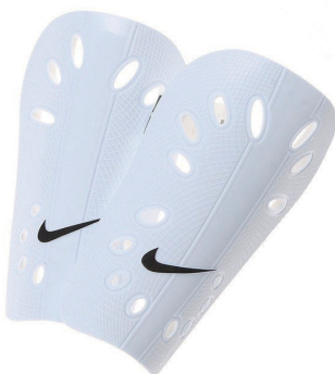
レガース(すねあて)